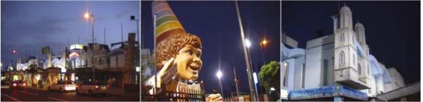
❶ - ❷ En el centro comercial Cita por la noche.

En Faro 2, hay una mezcla de un centro comercial moderno, la belleza del proyecto de arquitectura, y la comodidad de estar en una de las zonas más privilegiadas de la isla.