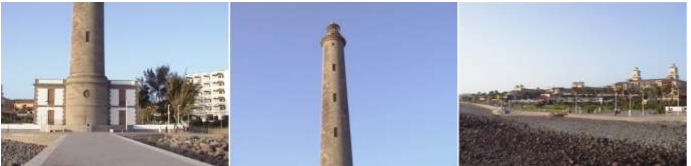
❶ Desde El espigón del Faro, Maspalomas al fondo. ❷ Parte superior, este faro se inició su construcción en 1884 y comenzó su funcionamiento en 1890, todo el conjunto se eleva a 60 metros. ❸ Las urbanizaciones de los hoteles al fondo.

El CITA centro comercial es uno de los centros comerciales más antiguos de Gran Canaria.