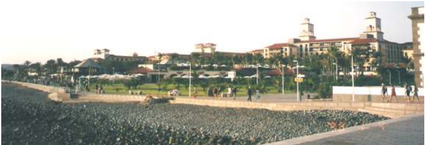
1 Playa de Costa Meloneras, en Maspalomas.

Nos acercamos con el bus que pone el hotel a Maspalomas