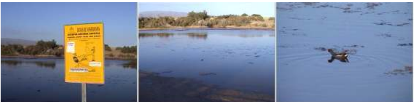
❶ - ❷ - ❸ La Charca de Maspalomas, es una pequeña laguna de aguas salobres, junto a la costa. GRAN CANARIA, Maspalomas MAYU ZUIU

Este espacio en el que habitan una flora especial, en algunos casos con especímenes endémicos y emparentado o relacionados con la fauna africana, y con especies que algunas son estables o son atraídas por las zonas húmedas. Algunas de estas charcas son auténticos verdegales.