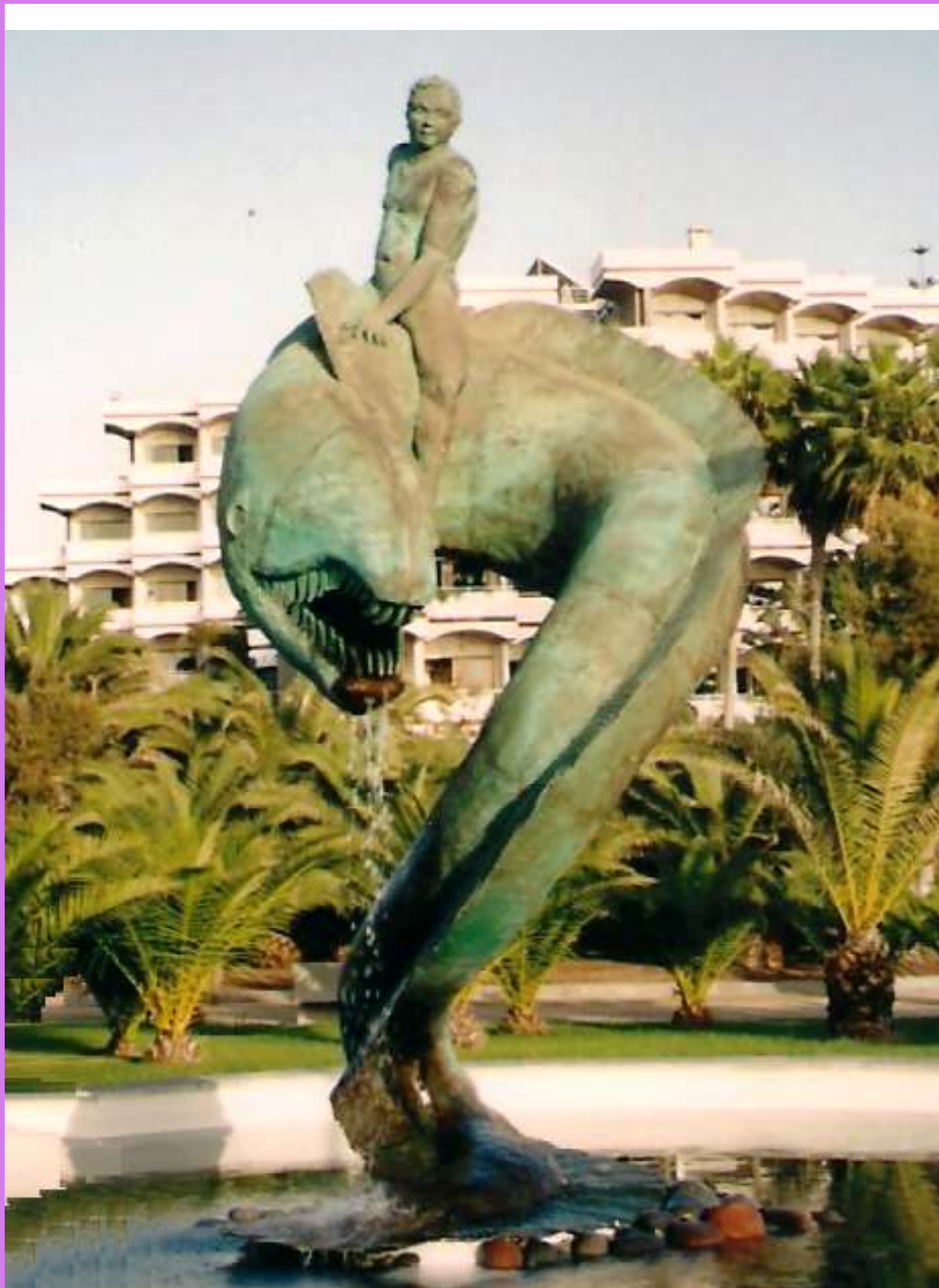
Fuente, junto al paseo del faro, en Maspalomas.