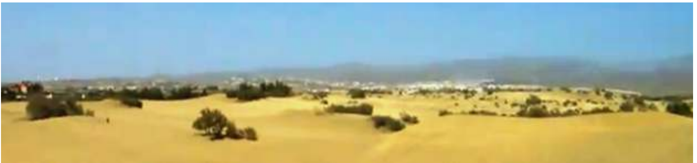
❶ Las dunas se asientan en un perímetro junto al mar. Y es el único que queda en Canarias.

Reserva Natural Especial de Las Dunas de Maspalomas, es un espacio comprendido entre los municipios y/o localidades de Más Palomas y Playa del Inglés.