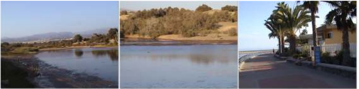
❶ - ❷ Dos imágenes de la charca, con su vegetación sobre el perímetro. ❸ El mirador que bordea un lado de la misma junto a las urbanizaciones.

Ni que decir, que es un espacio protegido y con unas normas para su visita y estancia en la zona.