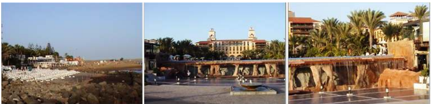
1 Una de las playas 2 Fachada de uno de los hoteles. 3 Con una gran cascada junto al paseo.

Y recorreremos toda la cornisa junto al mar, donde están los hoteles y establecimientos estivales,